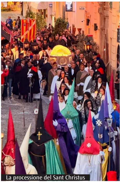
La processione del Sant Christus