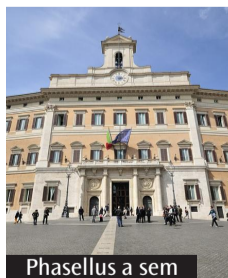
Phasellus a sem

to a mobilitare in maniera maggiore e a ottenere questo risultato. Ci sono - chiosa l'ex presidente - diverse considerazioni da fare. La prima non è di circostanza, ma è sentita: quando c'è una grande partecipazione popolare si tratta di un fatto positivo, soprattutto in tempi in cui la gente si allontana dagli strumenti della democrazia. La seconda è che emerge dal voto la fotografia di un Paese spaccato a metà: far finta che non esista il problema e che non sia percepito da una parte dei cittadini è un errore e vedere certe scene di giubilo lascia perplessi. L'aspetto che infine lascia amarezza - conclude Cappellacci - è che sia stata una campagna elettorale che si è giocata sugli slogan e sulle mistificazioni, più che sui contenuti, e questo dispiace».