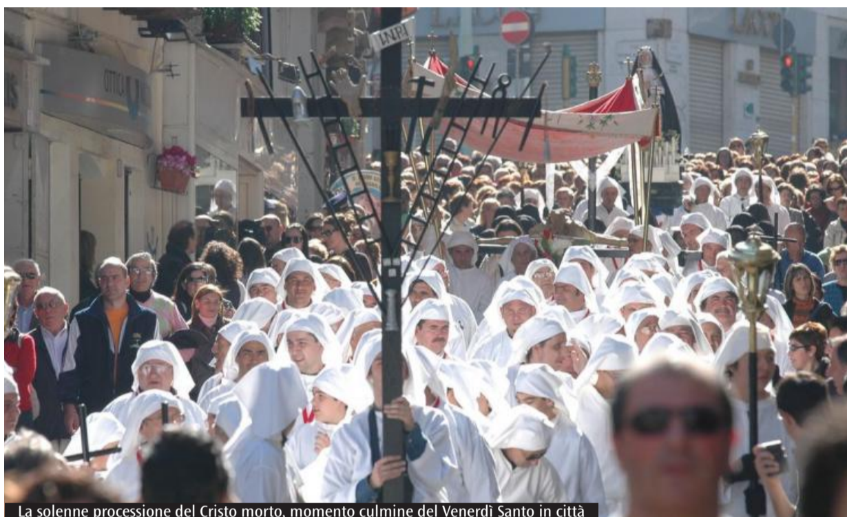
La solenne processione del Cristo morto, momento culmine del Venerdì Santo in città

Le confraternite, custodi di una tradizione antica, hanno accompagnato i