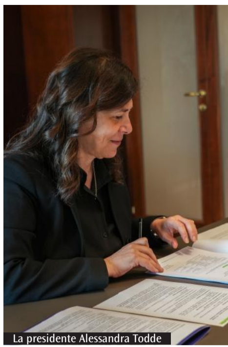
La presidente Alessandra Todde