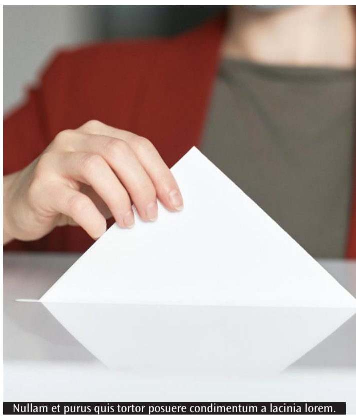
Nullam et purus quis tortor posuere condimentum a lacinia lorem.

L'esito del referendum, nel territorio regionale, è netto. Lo scrutinio parla chiaro: il 59,44% dei sardi che si sono recati alle urne non ha approvato la riforma della giustizia, inserita, come ha ricordato anche il presidente del Consiglio Giorgia Meloni, nel programma di governo con la quale la coalizione di centrodestra è risultata vincente alle scorse elezioni per il rinnovo dei due rami del Parlamento. Al momento nessun contraccampo si registra tra le fila dell'opposizione in Consiglio regionale, contrariamente a quanto accaduto a livello nazionale. Ma il risultato parla chiaro. In nessuna delle due Città metropolitane e nelle sei province ha prevalso il sì. Solo in Gallura la forbice è più ristretta, con i contrari in avanti per lo 0,77% sui favorevoli.