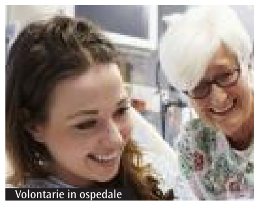
Volontarie in ospedale

vità creative per pazienti in attesa di cure. Centrale è anche la raccolta fondi destinata all'acquisto di strumentazioni mediche. A questo impegno si affianca quello dell'Avo Cagliari, che dallo scorso giugno opera nel day hospital di oncologia medica del Policlinico, offrendo vicinanza ai pazienti e alle loro famiglie. Accanto all'assistenza, non manca il sostegno alla ricerca. L'associazione «Il Giardino di Lu» finanzia borse di studio e progetti dedicati al tumore ovarico, oltre a promuovere iniziative come «Coloriamo i reparti», che portano fiori nei centri oncologici dell'isola. Il Giardino è anche un luogo di incontro per pazienti, familiari e cittadini. «Molte visitatrici sono donne che stanno affrontando o hanno affrontato il tumore e trovano qui uno spazio di condivisione e riflessione» spiega la