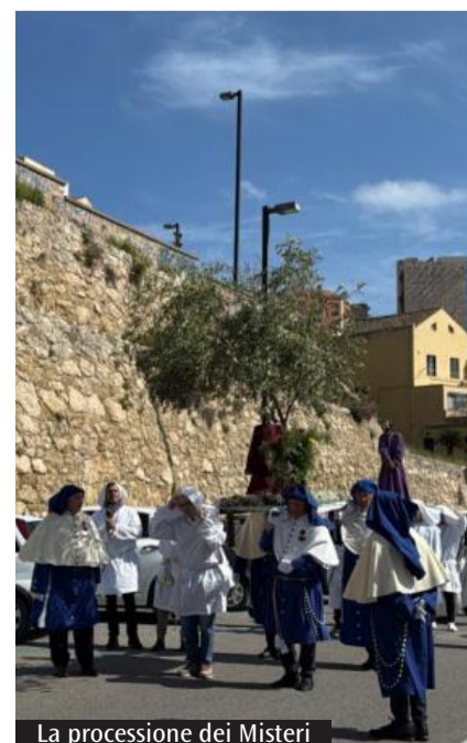
La processione dei Misteri

Nel racconto di Monsignor Ledda emerge anche la forza «sorprendente» della fede popolare, capace di riaccendersi anche quando sembra sopita. È l'esempio delle processioni storiche riprese dopo anni di interruzione, che hanno richiamato spontaneamente la partecipazione dei fedeli: segno di un legame mai interrotto tra la città e le sue tradizioni religiose. In questo orizzonte, la Settimana Santa a Cagliari si conferma non solo evento devozionale, ma esperienza collettiva che coinvolge memoria, identità e appartenenza. Un cammino che attraverso le strade del centro storico e, insieme, il vissuto delle persone, restituendo alla città un senso condizio del sacro e della storia.