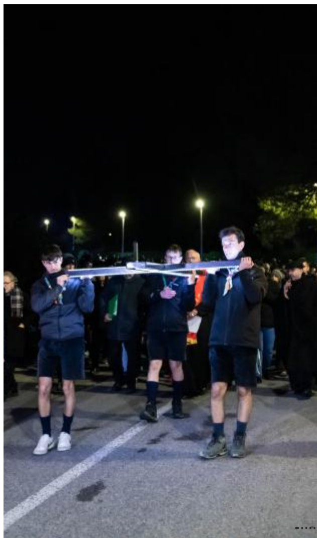
Ragazzi e ragazze appartenenti ai gruppi scout del capoluogo sono tra coloro che hanno il compito di portare la croce lungo il cammino fondato sulle 14 stazioni che, di tappa in tappa, portano i fedeli a riflettere sui passi di Gesù.