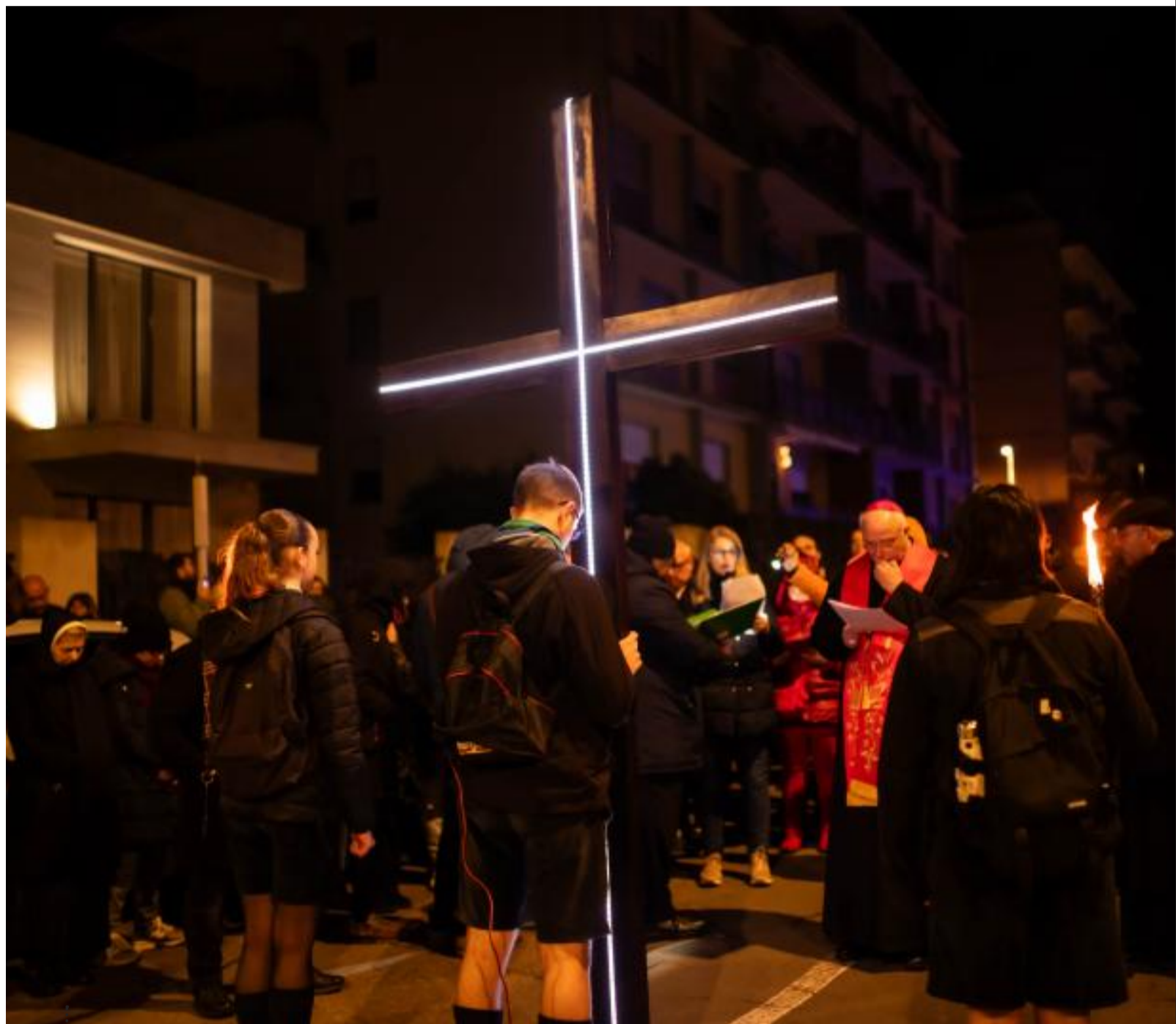
La croce ha camminato, insieme ai fedeli, per le strade della città, con tante persone in preghiera ripercorrendo la salita verso il Calvario di Gesù, meditando dunque il mistero della sua Passione e Morte lungo le vie cittadine che sono collocate all'interno del quartiere di Monte Urpinu.