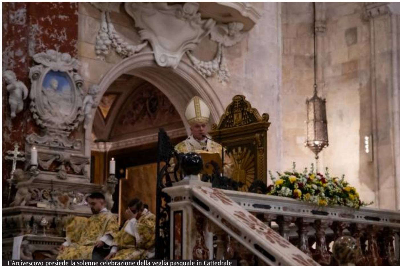
L'Arcivescovo presiede la solenne celebrazione della veglia pasquale in Cattedrale

Un compito affidato ai cristiani, chiamati ad annunciare «il bene della vita e la sua vittoria nell'amore», perché «in Cristo risorto le delusioni, lo sgomento e la paura vengono riconciliati».