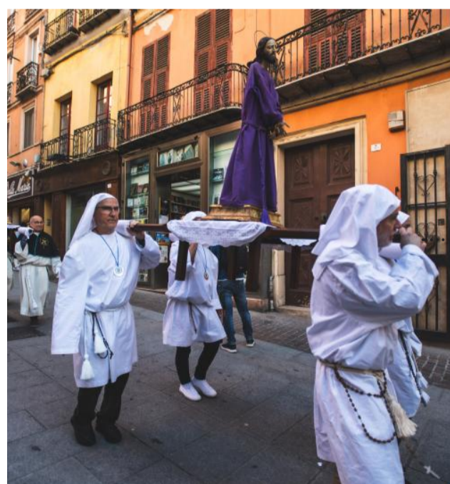
Il centro storico cagliaritano, il Martedì Santo e il Venerdì di Passione, vede rinnovata l'antica processione dei Misteri. Attenti registi di questo rito le storiche confraternite del capoluogo.