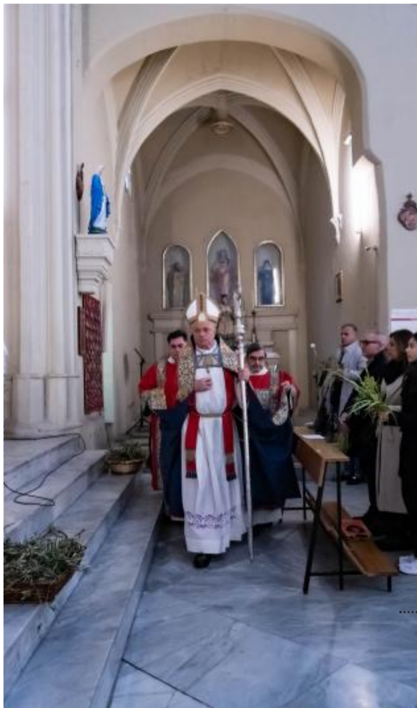
La Domenica delle Palme, con il suggestivo rito della benedizione dei rami intrecciati ad arte e di quelli degli alberi di ulivo. Nella foto a sinistra la celebrazione a Castello nella chiesa di Santa Lucia.