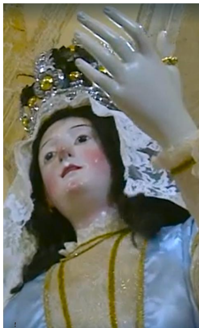
Il simulacro della Madonna sveste, la domenica di Pasqua, gli abiti del lutto portati durante la Settimana Santa e indossa gli ornamenti della festa durante le solenni processioni de s'Incontru, storico rito che si rinnova in tutte le nostre comunità parrocchiali.