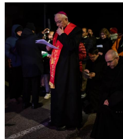
L'arcivescovo Giuseppe Baturi ha guidato questo momento di profonda fede e devozione durante il quale i fedeli hanno potuto effettuare la propria preghiera personale e silenziosa. Il cammino è stato compiuto grazie alle meditazioni realizzate per l'occasione e lette durante le soste.

Le immagini che seguono raccolgono alcuni dei momenti più intensi della Settimana Santa e del Triduo pasquale, vissuto come tempo di silenzio, preghiera e contemplazione. Volti, gesti e segni che raccontano una fede che si fa cammino, attraversa la sofferenza e si apre alla speranza. Nella Via Crucis, nelle celebrazioni liturgiche e nella partecipazione del popolo di Dio, si riflette il mistero di Cristo che ancora oggi condivide il dolore dell'umanità. Sono frammenti di un'esperienza che non si esaurisce nello sguardo, ma invita ciascuno a lasciarsi coinvolgere, a riconoscersi parte di una storia che continua. Ogni dettaglio custodisce un significato: la croce portata, il silenzio delle assemblee, la luce che lentamente ritorna. In queste immagini si conserva una memoria viva, capace di parlare al presente e di aprire il cuore alla speranza della Pasqua, che annuncia la vita più forte di ogni morte.