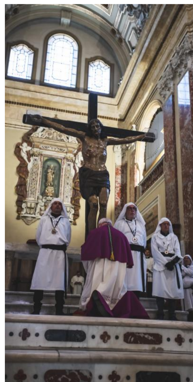
L'adorazione della Croce è uno dei momenti che caratterizzano la liturgia del Venerdì Santo, contraddistinta dalla preghiera silenziosa dinanzi a Cristo crocifisso. Nella foto il simulacro ligneo proveniente da San Giovanni.

Il Triduo pasquale si è aperto con la Messa in Coena Domini , che ha riproposto il gesto della lavanda dei piedi, compiuto da Gesù nel Cenacolo. Un rito carico di significato, che ha richiamato il servizio e l'umiltà, e che anche l'Arcivescovo ha rinnovato nella Cattedrale, coinvolgendo la comunità in un segno concreto di carità. La mattina del Giovedì Santo è stata segnata dalla Messa del Crisma, momento di comunione ecclesiale durante il quale i presbiteri hanno rinnovato le promesse sacerdotali e sono stati consacrati gli oli santi che accompagneranno la vita sacramentale dell'intero anno. Il Venerdì Santo ha condotto al cuore del mistero della Passione, con l'adorazione della Croce, segnata dal silenzio e dalla preghiera. È stato un tempo sospeso, in cui lo sguardo dei fedeli si è posato sul Cristo crocifisso, riconoscendo in Lui il dolore e la speranza dell'umanità. Infine oggi, domenica di Pasqua, celebriamo la gioia della Risurrezione con il tradizionale rito de «S'Incontru»: i simulacri del Cristo risorto e della Madonna, che ha deposto gli abiti del lutto per indossare quelli della festa, si incontrano tra le vie della città, testimoniando la vittoria della vita sulla morte. Un segno che, ancora oggi, unisce le comunità e rinnova il cuore della fede cristiana.