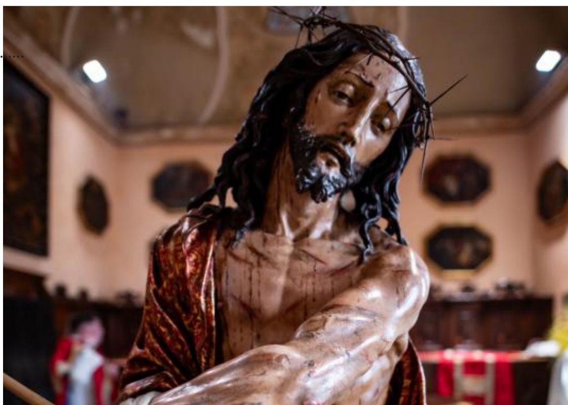
Il simulacro di Cristo porta sul proprio capo la corona di spine che rappresenta la sofferenza, l'umiliazione e il suo sacrificio, trasformati però in veri simboli di regalità divina e di vittoria sulla morte ma anche di gesto d'amore versato per salvare tutta l'umanità.