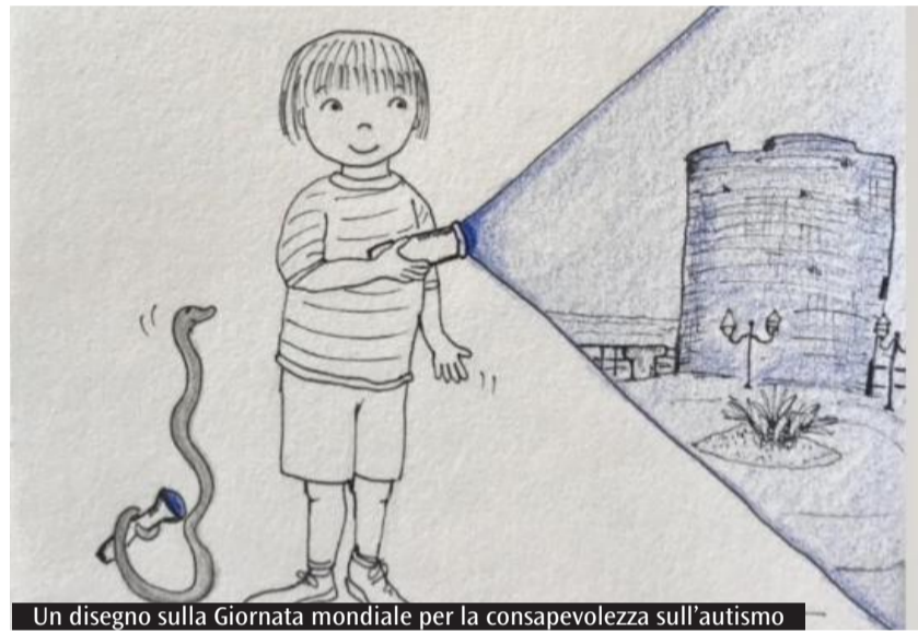
Un disegno sulla Giornata mondiale per la consapevolezza sull'autismo

Diverse le iniziative realizzate nella città per l'appuntamento dello scorso 2 aprile