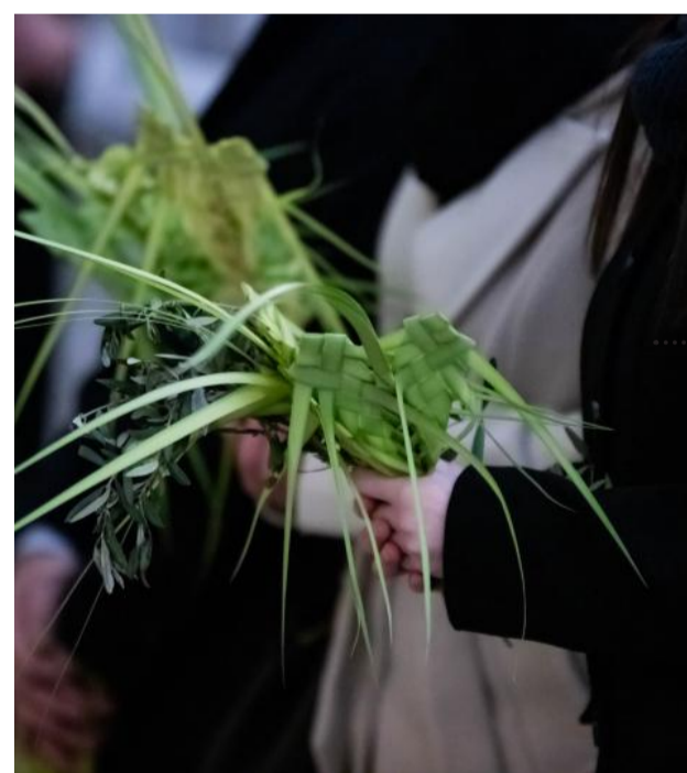
Un intenso scatto che mostra quanta arte sta dietro la realizzazione dell'intreccio dei rami di palma, simbolo di quanto accaduto oltre 2mila anni fa quando, come raccontano i Vangeli, Gesù fa il suo ingresso a Gerusalemme, accolto da folle festanti che, però, di lì a poco, invocheranno la sua condanna a morte.