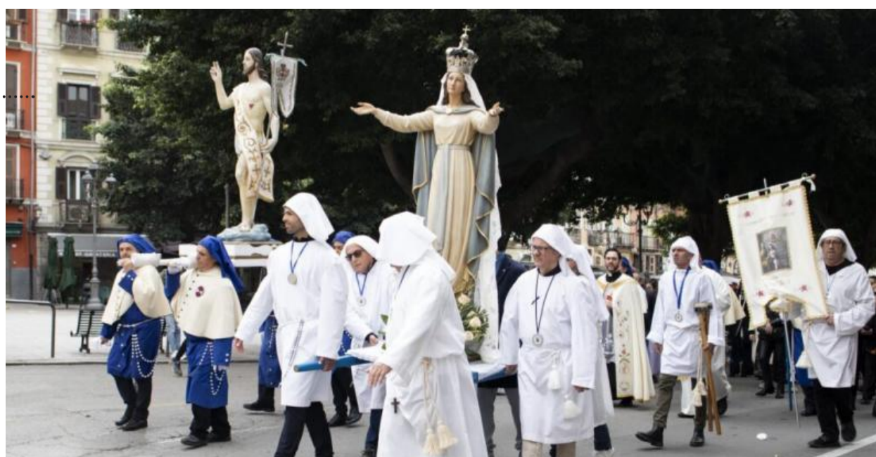
Le statue di Cristo risorto e della Madonna attraversano la centrale piazza Yenne del capoluogo. Il Signore mostra i segni della sua morte mentre la Vergine con indosso la corona esprime gioia per l'abbraccio con il figlio risorto da morte. Le confraternite tramandano attraverso i secoli questo storico rito.