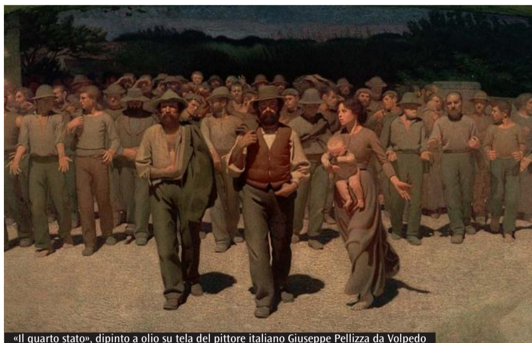
«Il quarto stato», dipinto a olio su tela del pittore italiano Giuseppe Pellizza da Volpedo

La riflessione della Chiesa si inserisce nel solco del magistero recente, segnato in modo particolare dall'insegnamento di papa Francesco, più volte richiamato anche da Bignami. Il suo sguardo attento ai