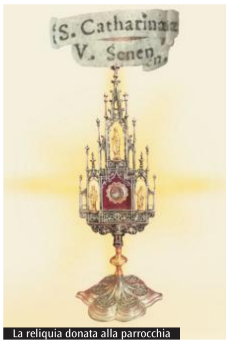
La reliquia donata alla parrocchia

sostare, in preghiera, davanti alla reliquia. In questo contesto, Vallermosa diventa simbolicamente un crocevia spirituale: «Nella sua periferia anche geografica si propone come trampolino per una riscoperta», osserva il parroco, indicando nella semplicità dei luoghi una forza capace di parlare al cuore. Una proposta che invita a guardare oltre le distanze e le marginalità, per ritrovare l'essenziale della fede. L'arrivo della reliquia non è dunque solo un evento devozionale, ma un'occasione per rimettere al centro il Vangelo vissuto. Come conclude don Murgia, «è importante riscoprire il cuore», perché solo da lì può nascere un autentico cammino caratterizzato da pace e comunione.