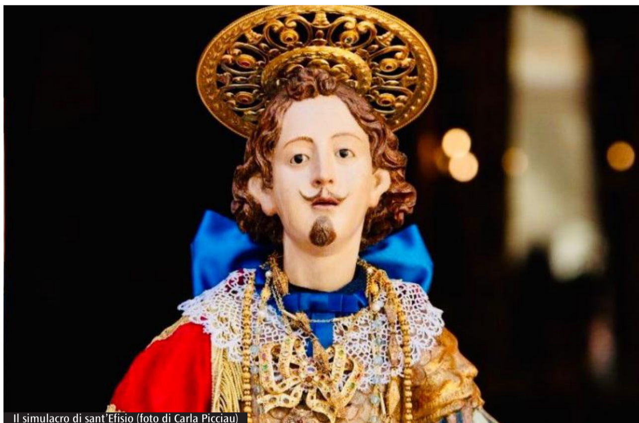
Il simulacro di sant'Efisio