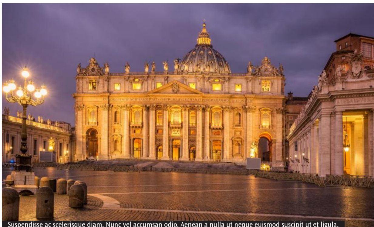
Suspendisse ac scelerisque diam. Nunc vel accumsan odio. Aenean a nulla ut neque euismod suscipit ut et ligula.

A un anno dalla scomparsa di papa Francesco e nei primi passi del pontificato di papa Leone XIV, la Chiesa si interroga su continuità e prospettive, tra memoria e futuro. È il filo conduttore dell'approfondimento proposto da Radio Kalaritana, che ha offerto uno sguardo corale su un passaggio che non è solo cronologico, ma profondamente ecclesiale e culturale. L'arcivescovo Giuseppe Baturi ha richiamato anzitutto il significato stesso del ministero petrino: «Il Papa è un dato di fede, un dato di mistero, che incarna dentro la Chiesa la successione di Pietro a favore della solidità della verità e della comunione nella carità». Da qui la sottolineatura dei temi centrali dell'eredità di Francesco, a partire dalla misericordia, «non soltanto come un fatto etico individuale ma come un dato politico», capace di opporsi alla cultura dello scarto e alla guerra. Nel solco di questa eredità, il nuovo pontificato appare segnato da una forte concentrazione su Cristo e sull'unità. «Ha chiesto di mettere Cristo al centro per ritrovare il fonda-