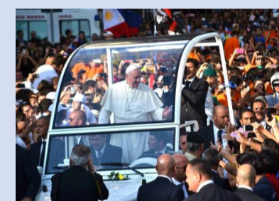
La Papamobile attraversa il largo Carlo Felice dove decine di migliaia di giovani, nel settembre del 2013, avevano atteso Francesco