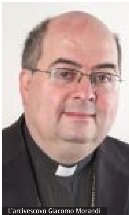
L'arcivescovo Giacomo Morandi