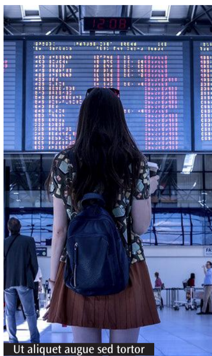
Ut aliquet augue sed tortor