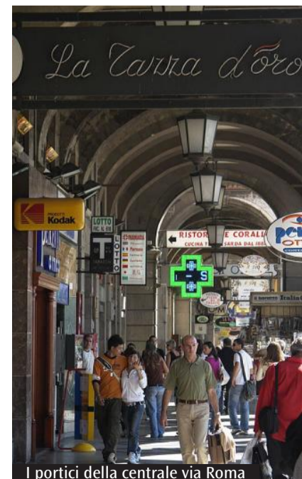
I portici della centrale via Roma

be presentare qualche imprevisto a causa, soprattutto, dei problemi legati al trasporto aereo tra caro prezzi e reperimento di jet fuel per le compagnie. «Guardando il bicchiere mezzo pieno - conclude Zazzara - per la Sardegna le tensioni internazionali potevano essere quasi un'opportunità, vista la sicurezza assicurata rispetto ad altre mete. Quello che fa paura ora è la questione del caro carburante. Sono tante le persone che prenotano ma che cancellano, oppure che prenotano soltanto se sono sicuri di poter cancellare gratuitamente all'ultimo momento la prenotazione perché hanno paura che le compagnie aeree cancellino improvvisamente il volo perché non conveniente o lo posticipino».