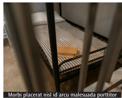
Morbi placerat nisl id arcu malesuada porttitor

sità e una forte indigenza», ha osservato Mocchi, ricordando che numerosi detenuti provengono da contesti segnati dalla povertà e dalla fragilità sociale. Una riflessione che richiama anche la dottrina sociale della Chiesa e il magistero di Papa Francesco, più volte intervenuto sul tema della dignità delle persone detenute e della necessità di costruire percorsi autentici di reinserimento. Per Mocchi, la società è chiamata a compiere un cambiamento culturale profondo: «La popolazione deve cambiare comportamento o quantomeno forma mentale rispetto al mondo della detenzione e della privazione della libertà». Non si tratta, ha precisato, di giustificare i reati, ma di comprendere il contesto umano e sociale nel quale maturano molte storie di devianza. In tanti casi, infatti, il carcere accoglie persone finite ai margini per una lun-