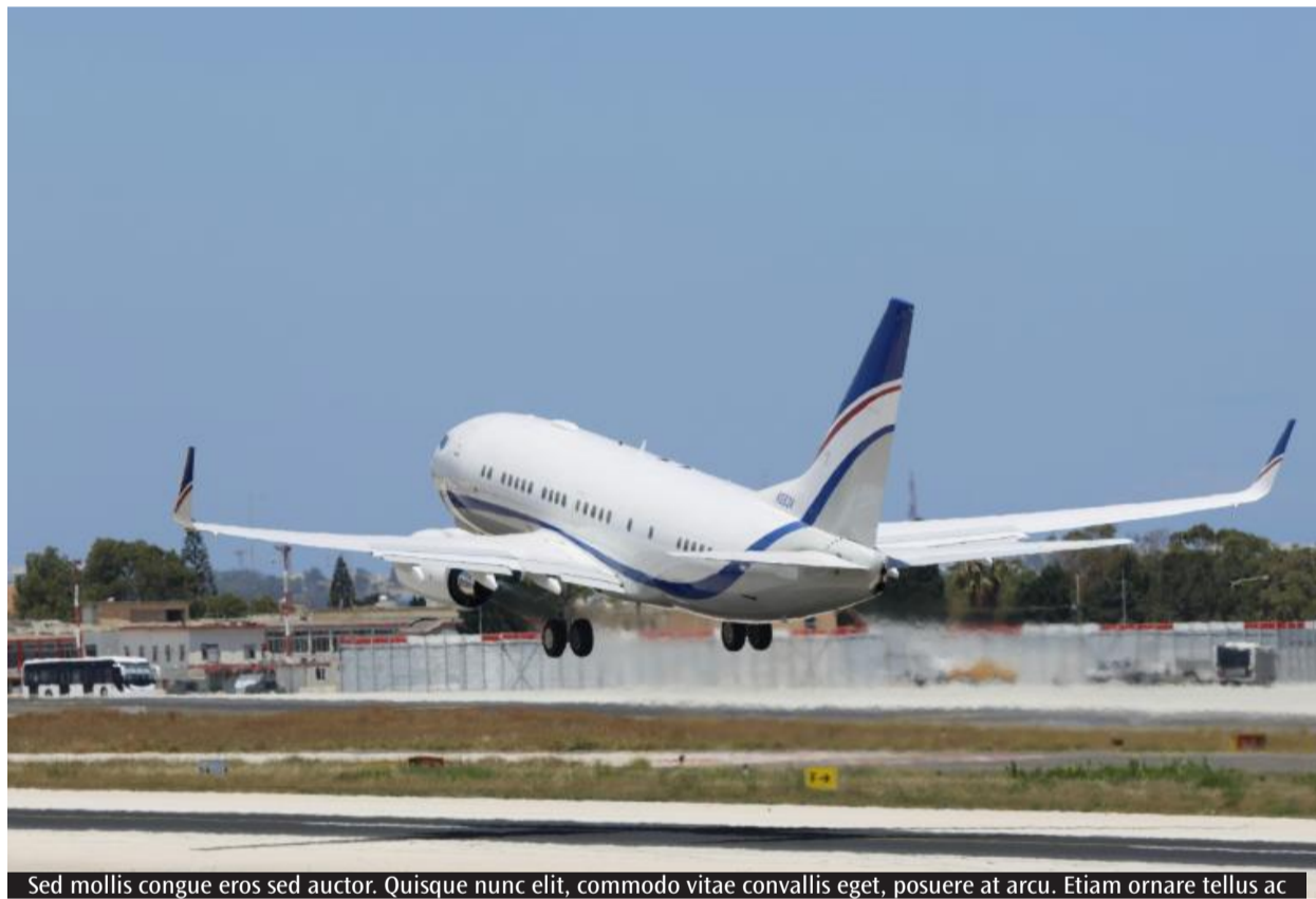
Sed mollis congue eros sed auctor. Quisque nunc elit, commodo vitae convallis eget, posuere at arcu. Etiam ornare tellus ac

Negli ultimi mesi il timore di rincari improvvisi sui biglietti aerei e di possibili riduzioni dei collegamenti aveva alimentato una certa cautela nelle prenotazioni. Ma, secondo Fiavet, i dati reali mostrano una situazione più stabile rispetto a quanto percepito dall'opinione pubblica. «Stiamo ricevendo comunicazioni da