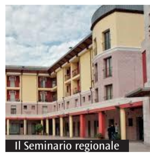
Il Seminario regionale

Al di sopra della formazione pratica vi è un percorso di formazione umana e spirituale, tema fondamentale per poter costruire delle comunità accoglienti, capaci di farsi promotori di uno sviluppo integrale della persona umana e attente ai bisogni dei più fragili. Riguardo quest'ultimo tema, i seminaristi vengono formati sulla tutela dei minori grazie a dei percorsi specifici. Il Seminario, grazie