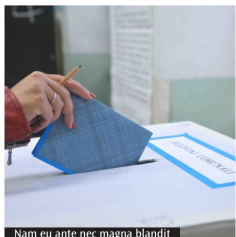
Nam eu ante nec magna blandit

Sono 148 i municipi regionali interessati da questa tornata elettorale dove, in alcuni paesi, si registra una sola lista in campo