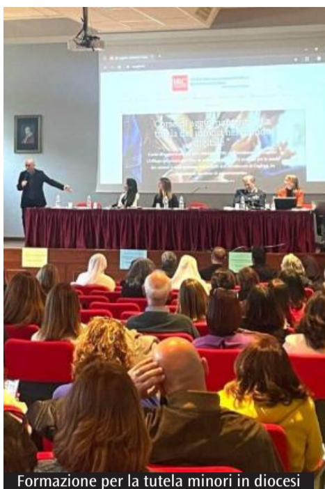
Formazione per la tutela minori in diocesi

ha infatti ottenuto il patrocinio del Consiglio nazionale delle ricerche e di diversi ordini professionali, tra cui medici, avvocati, psicologi e assistenti sociali, con il riconoscimento di crediti formativi per i partecipanti. «È bello - sottolinea - evidenziare che la Chiesa sta offrendo un momento formativo veramente riconosciuto da questi ordini e qualificato come momento formativo per i professionisti che lavorano nell'ambito». Un elemento che testimonia come la tutela non sia materia riservata a pochi specialisti. «La tutela non è la materia di un ufficio o di una professionalità e basta, è un lavoro di sinergia», afferma. Una convinzione che si riflette anche nella collaborazione tra i diversi uffici pastorali coinvolti nell'organizzazione dell'evento e che continuerà a orientare il lavoro futuro. «Il nostro lavoro nel territorio continuerà a essere sempre questo: camminare insieme alle comunità e offrire ciò di cui ogni comunità ha bisogno». Nel pomeriggio il percorso proseguirà con un laboratorio interdisciplinare rivolto agli studenti e agli operatori pastorali. (M.L.S.)