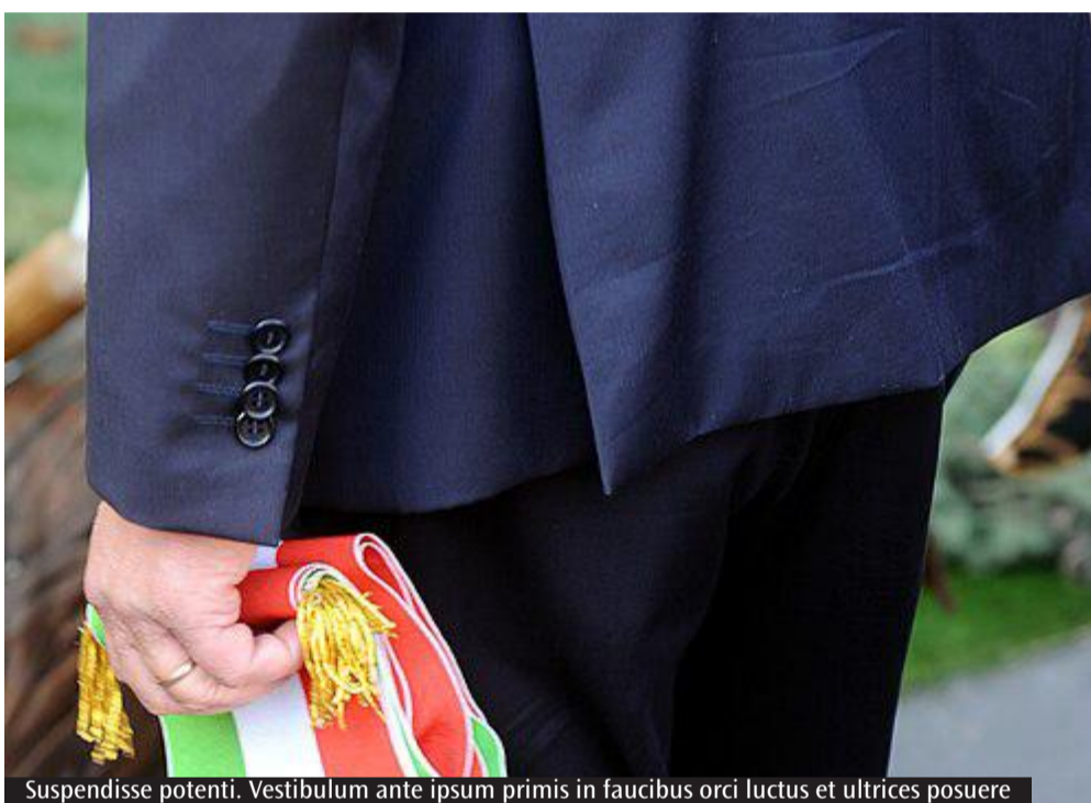
Suspendisse potenti. Vestibulum ante ipsum primis in faucibus orci luctus et ultrices posuere