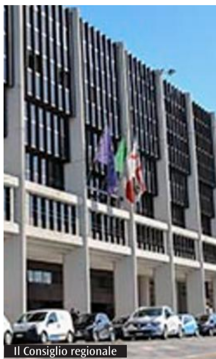
Il Consiglio regionale

per Riformatori, Alleanza Sardegna e Sardegna 20Venti - hanno attaccato la maggioranza annunciando la presentazione di due emendamenti alla variazione di bilancio da 750 milioni di euro. Le proposte prevedono uno stanziamento da 14 milioni per abolire sperimentalmente l'addizionale nei mesi compresi tra ottobre e aprile e un secondo intervento da 35 milioni per cancellarla per tutto l'anno. Secondo il capogruppo di FdI Paolo Truzzu, Ryanair rappresenta ormai un attore decisivo nel mercato del trasporto aereo europeo e ignorarne le richieste rischierebbe di penalizzare l'isola. «Il mercato è cambiato - sostiene - e nelle altre regioni la compagnia ha contribuito a far crescere il turismo». (A.L.)