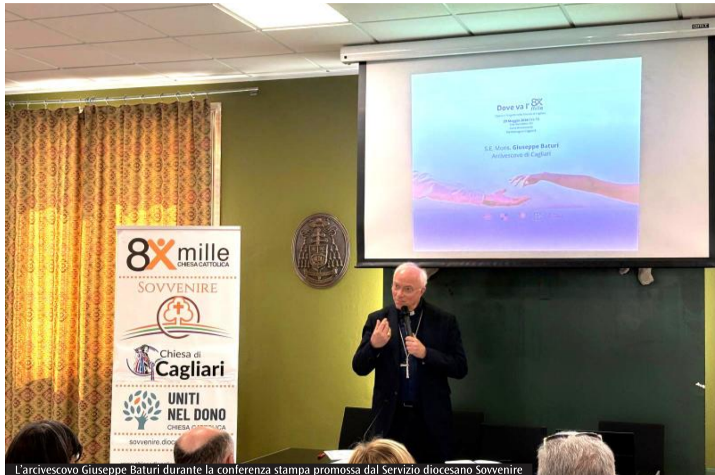
L'arcivescovo Giuseppe Baturi durante la conferenza stampa promossa dal Servizio diocesano Sovvenire

Tra i cosiddetti «segni giubilari» rientrano il microcredito «Mi fido di noi», i centri di accoglienza Caritas, il sostegno al Centro di aiuto alla vita e percorsi di reinserimento sociale, per un totale di 85.000 euro. Ulteriori risorse sono state destinate ad