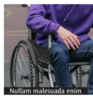
Nullam malesuada enim

ostegni previsti dalle istituzioni pubbliche. Importante anche il percorso di sensibilizzazione sull'affettività e la sessualità delle persone con disabilità, che ha contribuito ad aprire nuove riflessioni tra genitori e comunità. Un altro ambito su cui si sta investendo riguarda l'autismo e il