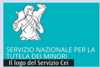
SERVIZIO NAZIONALE PER LA TUTELA DEI MINORI Il logo del Servizio Cei

Tra i primi compiti, al Servizio sono affidate la promozione e l'accompagnamento delle attività di prevenzione