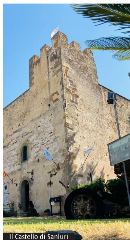
Il Castello di Sanluri

Essendo capoluogo della rinata provincia del Medio Campidano in questo centro si applicano le norme previste dalla legge al di sopra della quota dei 15mila residenti