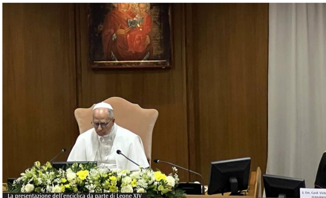
La presentazione dell'enciclica da parte di Leone XIV