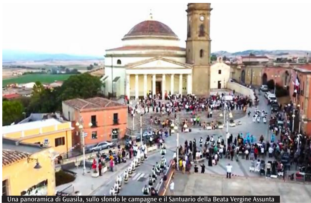
Una panoramica di Guasila, sullo sfondo le campagne e il Santuario della Beata Vergine Assunta

si. Tre azioni che consentono di rendere la cultura una risorsa sotto più punti di vista. E che possono convivere anche con altre storie ed eventi importanti, come nel caso di Villaurbana, comune dell'oristanese noto per l'arte della panificazione che tra il 5 e il 10 giugno sta ospitando «Trigu - Festival della Filosofia».