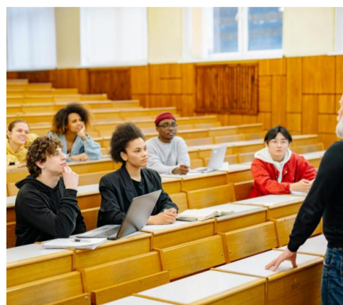
Grazie alle firme nelle dichiarazioni dei redditi, nascono percorsi di crescita spirituale e formativa

inoltre gli incontri culturali con personalità del mondo accademico e istituzionale, come Marta Cartabia, e il progetto «La Bussola», un percorso di discernimento realizzato con il supporto dei Gesuiti per aiutare i giovani a orientarsi nelle scelte della vita. Guardando al futuro, la Pastorale universitaria ha annunciato anche un'esperienza particolarmente attesa: il Cammino di Santiago, in programma tra luglio e agosto, occasione per coniugare crescita spirituale, amicizia e condivisione. Tutte le informazioni sono reperibili sul sito www.8xmille.it , sul sito dell'Arcidiocesi di Cagliari e sui canali social del Servizio diocesano Sovvenire. Ricordiamo che la trasmissione va in onda la domenica alle 18 e in replica il giovedì alle 8.30.