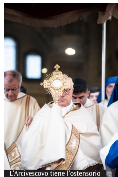
L'Arcivescovo tiene l'ostensorio

Oggi la Chiesa celebra la Solennità del Corpus Domini, una delle ricorrenze più significative dell'anno liturgico, dedicata al mistero dell'Eucaristia, fonte e culmine della vita cristiana. In città, alle 19, nella Cattedrale di Santa Maria, l'Arcivescovo monsignor Giuseppe Baturi presiederà la Messa solenne, alla quale seguirà la tradizionale processione eucaristica per le vie del centro storico cittadino, con conclusione presso la chiesa di Sant'Anna. Si tratta di un appuntamento particolarmente caro alla comunità diocesana, che ogni anno riunisce sacerdoti, religiosi, confraternite, associazioni ecclesiali e numerosi fedeli in un momento di intensa preghiera e di pubblica testimonianza della fede.