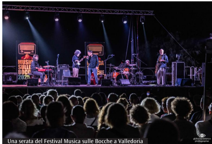
Una serata del Festival Musica sulle Bocche a Valledoria