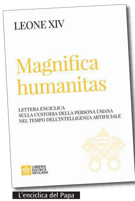
L'enciclica del Papa

Gli organizzatori segnalano che sono disponibili gli ultimi posti e invitano gli interessati a manifestare quanto prima la propria adesione. Per informazioni e iscrizioni è possibile contattare: don Zanda: diegozanda@gmail.com e padre Papaluca SJ: papaluca.m@gesuiti.it.