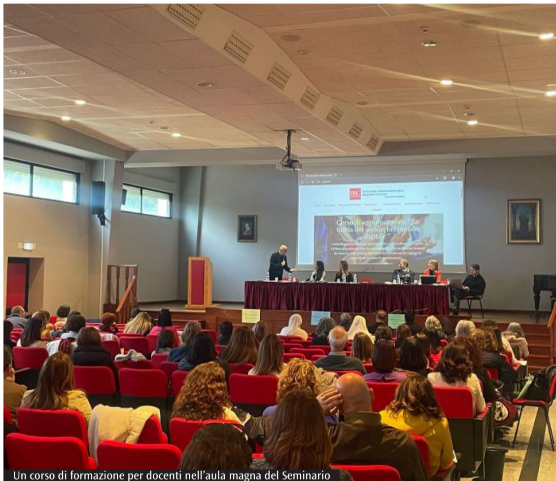
Un corso di formazione per docenti nell'aula magna del Seminario