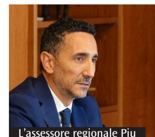
L'assessore regionale Piu

gi per gli automobilisti. Disagi che l'assessore non nega, ma che considera necessari per migliorare le condizioni della rete viaria. «Capisco benissimo - ha sottolineato - le difficoltà che ci sono in questo momento per chi viaggia, ma se vogliamo una maggiore sicurezza i lavori van-