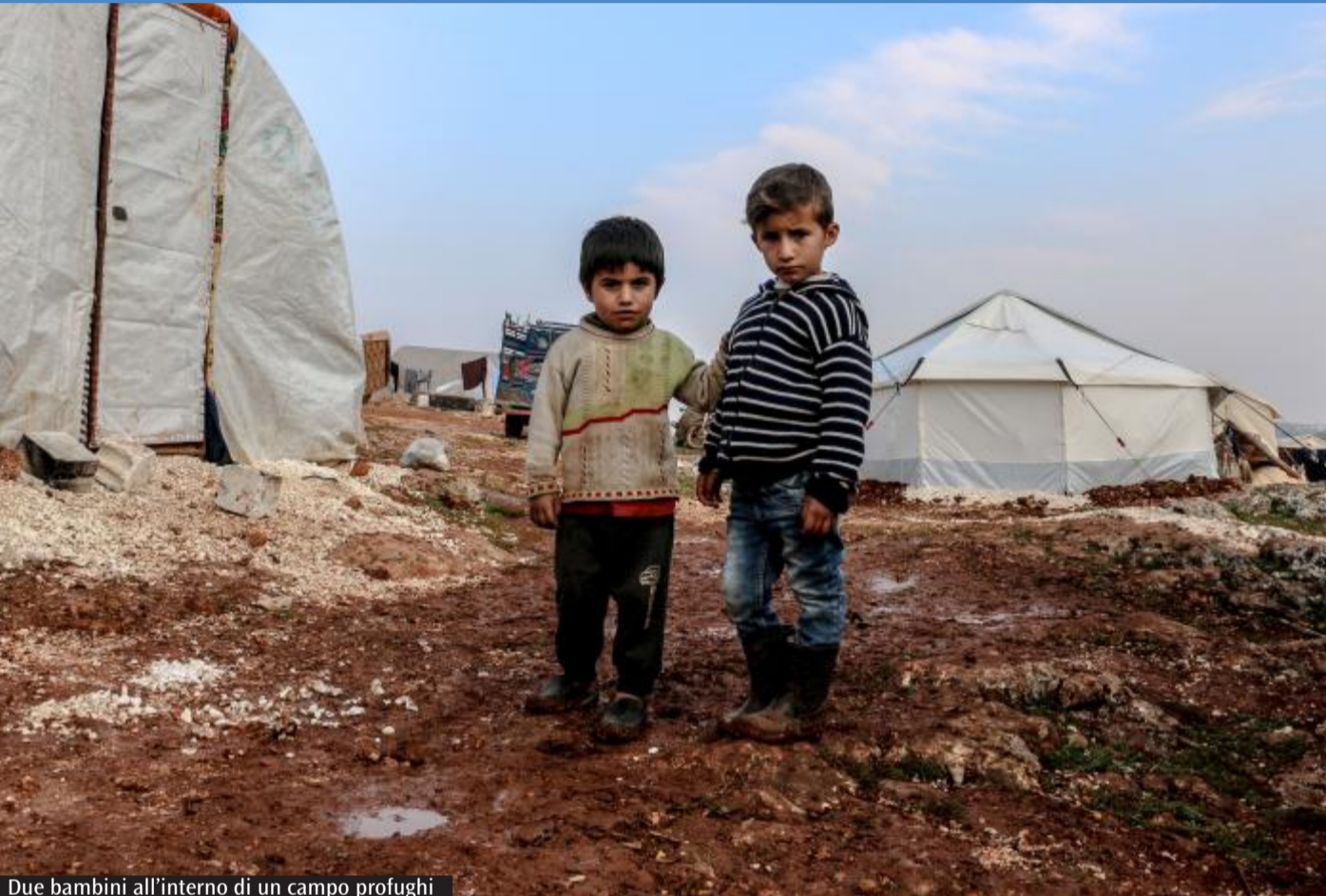
Due bambini all'interno di un campo profughi