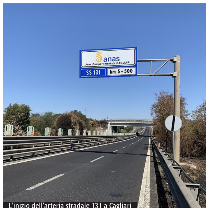
L'inizio dell'arteria stradale 131 a Cagliari