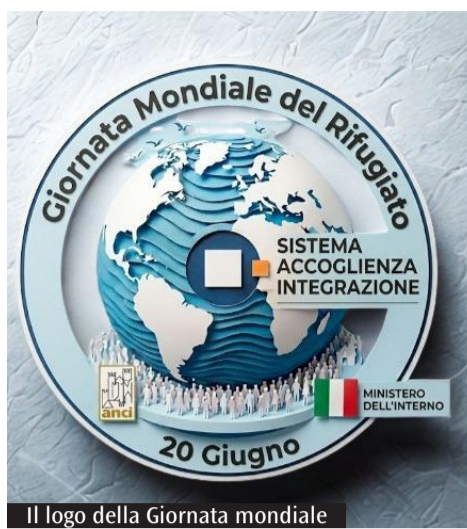
Il logo della Giornata mondiale