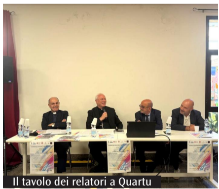
Il tavolo dei relatori a Quartu