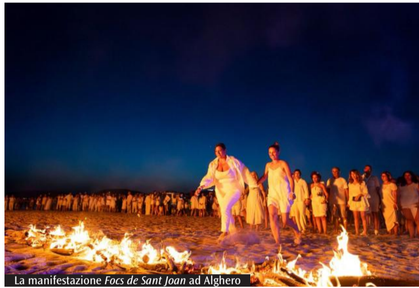
La manifestazione Focs de Sant Joan ad Alghero

La Riviera del Corallo si anima tra falò e numerosi spettacoli in località suggestive