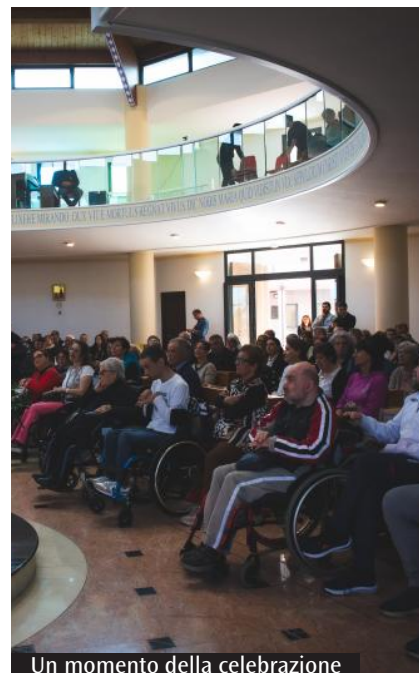
Un momento della celebrazione