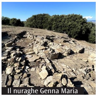
Il nuraghe Genna Maria

laboratori esperienziali come «A-bruxa», incentrato sui riti della notte di San Giovanni, e racconti in lingua sarda per accompagnare le visite guidate al nuraghe. Non può mancare l'omaggio al sole, con una suggestiva osservazione del tramonto e del cie-