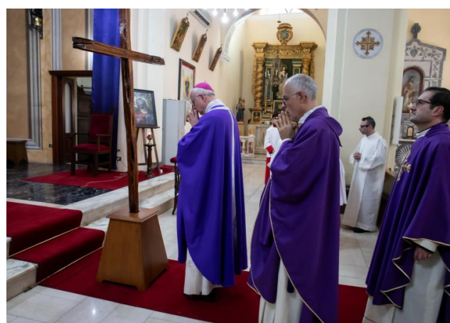
Le parrocchie delle foranie di Dolianova, di Guasila e di Pula si sono unite in tre distinti momenti per vivere con Baturi un momento comunitario di preghiera, in questo particolare Tempo che ci invita a seguire Cristo