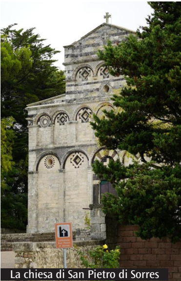
La chiesa di San Pietro di Sorres