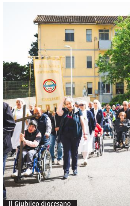
Il Giubileo diocesano

Allo stesso tempo «anche la Chiesa – sottolinea don Quaranta – deve camminare per liberarsi di alcuni stigmi, come la visione assistenzialista, e acquisire una maggiore conoscenza del mondo della disabilità. Dunque il convegno "Noi pellegrini di speranza", nell'ambito del Giubileo a Roma è servito proprio a dare questa immagine di cammino in cui coniugare diversi aspetti, fra i quali l'arte, la musica, il teatro, la cinematografia, il mondo della legislazione (con il decreto sul progetto di vita) e della tecnologia, ambiti nei quali è possibile promuovere un ruolo attivo». Due le prospettive emerse dal Giubileo. «Quella di costruire reti – afferma don Quaranta – per sostenere il mondo della fragilità e quella dell'ascolto: non basta sentire, bisogna ascoltare, ovvero comprendere profondamente il punto di vista e le esigenze dell'altro, e vedere come dare risposte con azioni concrete e significative». Il tema del cammino è stato anche al centro del Giubileo diocesano, nel mese di maggio, che ha visto il pellegrinaggio dal parco di Monte Claro alla cappella del Seminario regionale, con la messa celebrata dall'arcivescovo.