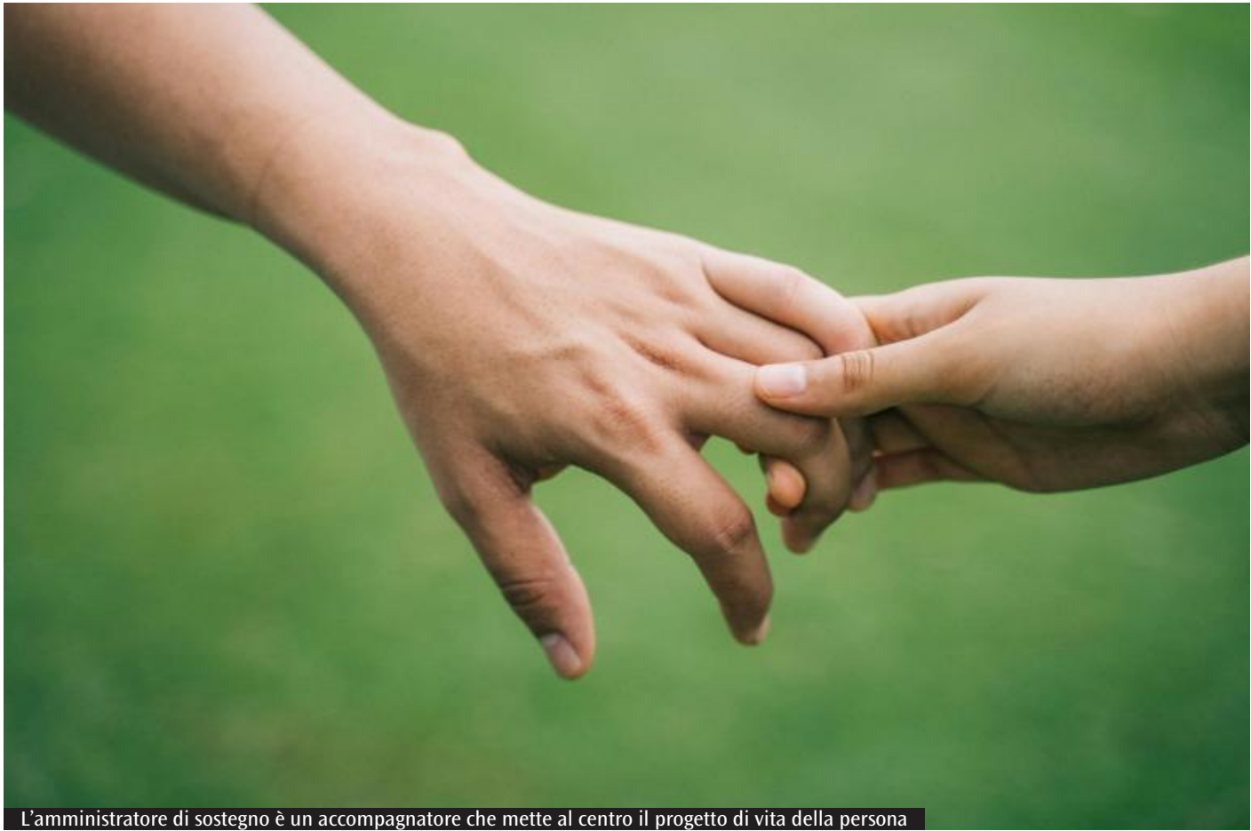
L'amministratore di sostegno è un accompagnatore che mette al centro il progetto di vita della persona

Qual è il ruolo del Corpo di San Lazzaro in Sardegna su questo tema? Questa organizzazione è attiva nel promuovere la conoscenza di queste figure. Da due anni abbiamo avviato percorsi gratuiti di formazione rivolti soprattutto ai familiari che si trovano improvvisamente a dover assumere questo ruolo. Offriamo una formazione pratica con strumenti giuridici, amministrativi, economici e relazionali per svolgere questo ruolo con