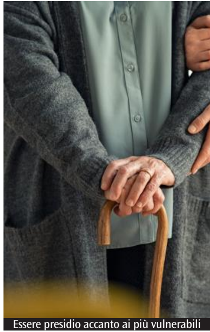
Essere presidio accanto ai più vulnerabili