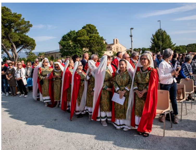
Nella forania del Campidano (foto a sinistra), l'antica chiesa di San Lussorio ha accolto numerosi fedeli provenienti dai comuni dell'Area vasta cagliaritana. La basilica di Sant'Elena (foto a destra) ha ospitato i pellegrini in occasione della festa per la Madonna di Fatima

L'arcivescovo, nel giorno della festa per don Bosco, ha consegnato a San Paolo la sua lettera pastorale, segno di attenzione ai giovanissimi impegnati nel territorio