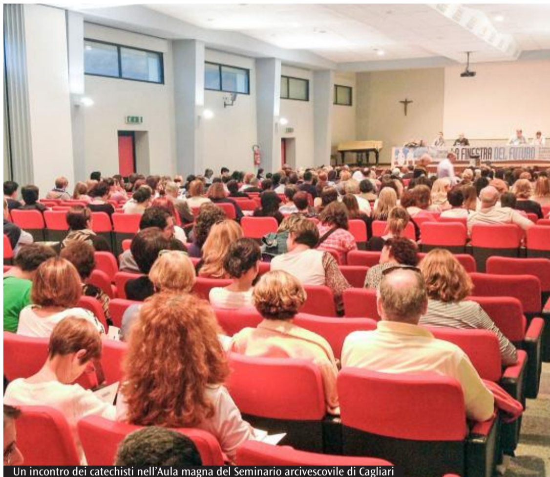
Un incontro dei catechisti nell'Aula magna del Seminario arcivescovile di Cagliari