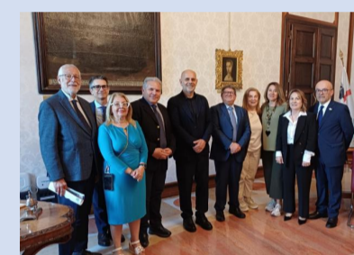
Un momento della cerimonia, svoltasi a Palazzo Belgrano dell'Università di Cagliari, dove il regista Riccardo Milani ha ricevuto il Premio