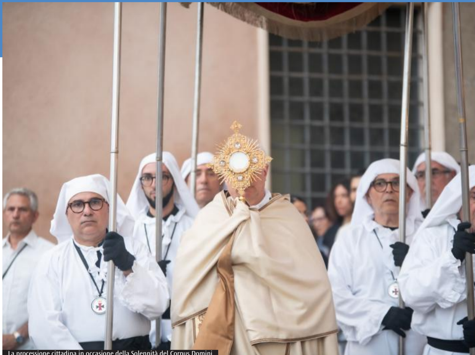
La processione cittadina in occasione della Solennità del Corpus Domini

Da qui nasce una consapevolezza fondamentale: «La memoria di Dio è la memoria della propria storia». È nella trama concreta degli avvenimenti, degli incontri e delle prove che la misericordia divina si rivela e continua a parlare agli uomini. L'invito riguarda anche i cristiani di oggi. «L'infedeltà nostra e del popolo è anzitutto espressa nella