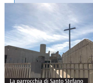
La parrocchia di Santo Stefano

L'appuntamento è promosso dalla parrocchia quartese, in collaborazione con l'Ucsi Sardegna e con l'Ufficio diocesano per le comunicazioni sociali.