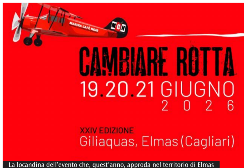
La locandina dell'evento che, quest'anno, approda nel territorio di Elmas

Dopo 23 anni l'evento lascia il capoluogo e approda nella laguna di Giliacquas