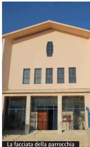
La facciata della parrocchia