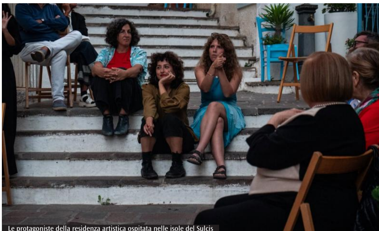
Le protagoniste della residenza artistica ospitata nelle isole del Sulcis

Dal 2023 il progetto si sviluppa attraverso una residenza artistica ospitata nelle isole del Sulcis. Ogni anno viene pubblicato un bando nazionale rivolto a collettivi e autori chiamati a confrontarsi con uno specifico tema legato agli obiettivi dell'Agenda 2030. Per