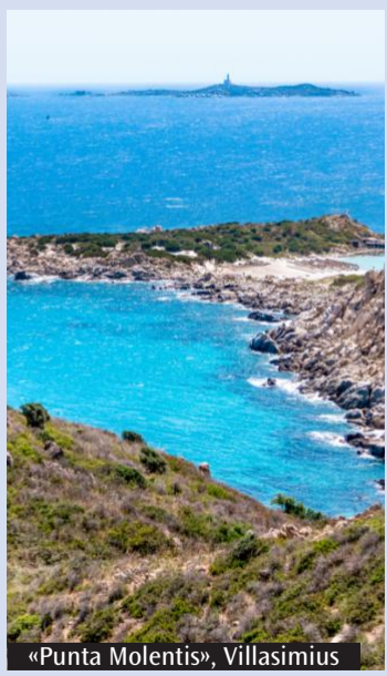
«Punta Molentis», Villasimus

Particolare attenzione è riservata anche alle celebrazioni nei luoghi maggiormente frequentati dai villeggianti, come Nora, Cala Verde, Costa Rei e le altre località costiere del territorio, per consentire a tutti di vivere l'Eucaristia anche durante il tempo delle vacanze. La Chiesa di Cagliari invita i fedeli a riscoprire il valore della domenica e della partecipazione alla Messa quale momento centrale della vita cristiana, anche nel periodo estivo, quando il riposo e il tempo libero possono diventare occasione di incontro con il Signore e di crescita nella fede.