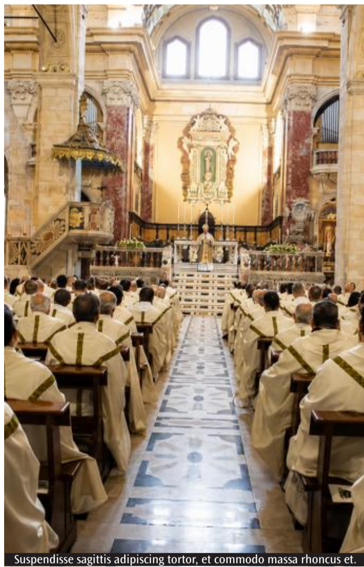
Suspendisse sagittis adipiscing tortor, et commodo massa rhoncus et.

Gli anniversari sacerdotali non sono soltanto una ricorrenza personale, ma una festa per l'intera comunità ecclesiale. Cinquant'anni o sessant'anni di ministero raccontano una vita spesa nell'annuncio del Vangelo, nella celebrazione dei sacramenti e nell'accompagnamento del popolo di Dio lungo le gioie e le fatiche dell'esistenza. Celebrarli significa riconoscere il valore del ministero sacerdotale, dono prezioso per la Chiesa, e rendere grazie per la fedeltà di quanti hanno risposto con perseveranza alla chiamata del Signore. È anche l'occasione per riscoprire il profondo legame che unisce i presbiteri tra loro e con il proprio vescovo: una comunione che trova la sua sorgente nell'unico sacerdozio di Cristo e che si traduce nella corresponsabilità pastorale al servizio della diocesi. In un tempo che interpella la Chiesa con nuove sfide, la testimonianza di sacerdoti che hanno attraversato decenni di storia con dedizione e generosità, diventa segno di speranza e incoraggiamento per le nuove generazioni e per tutto il popolo di Dio.