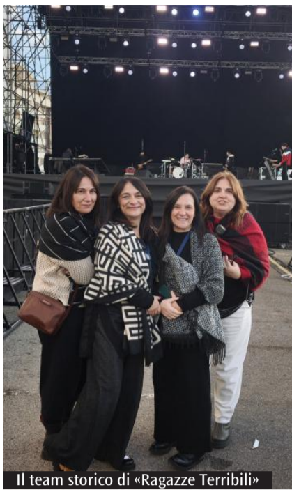
Il team storico di «Ragazze Terribili»

zione di «Abbabula», la sfida rimane la stessa degli inizi: costruire comunità attraverso la cultura. In un tempo segnato da individualismi e frammentazioni, l'esperienza di «Ragazze Terribili» dimostra come la musica possa ancora essere un luogo di incontro, crescita e partecipazione. Tra gli appuntamenti di punta dell'estate 2026 spicca il concerto di Ben Harper & The Innocent Criminals, in programma mercoledì 1 luglio alla Fiera di Cagliari. L'evento, organizzato in collaborazione con Made in Sound, rappresenta una delle date più attese della stagione musicale isolana e conferma la vocazione della cooperativa a costruire ponti tra la Sardegna e i grandi circuiti della musica mondiale. L'arrivo del cantautore statunitense si inserisce perfettamente nella filosofia che da sempre ispira il lavoro della cooperativa.