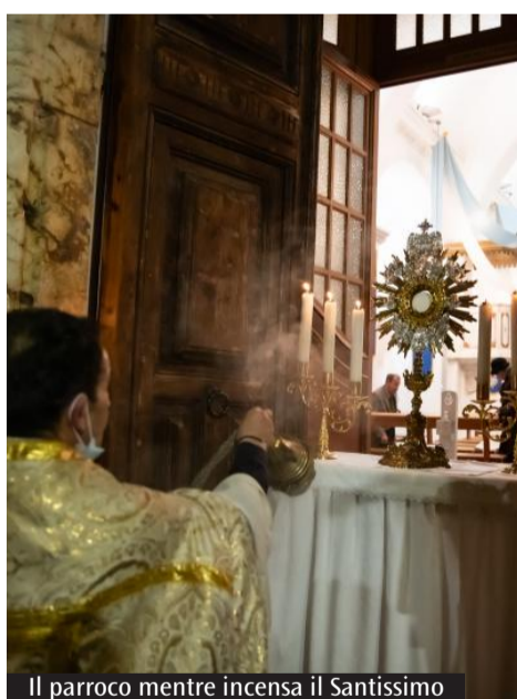
Il parroco mentre incensa il Santissimo