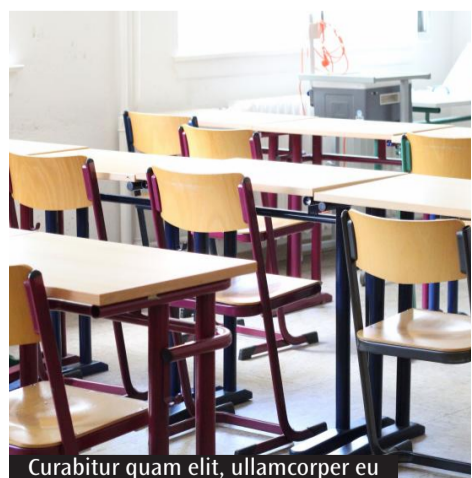
Curabitur quam elit, ullamcorper eu

Il presidente regionale dell'Anp, l'associazione dei dirigenti della scuola, evidenzia l'alto tasso di quanti ripeteranno la quinta