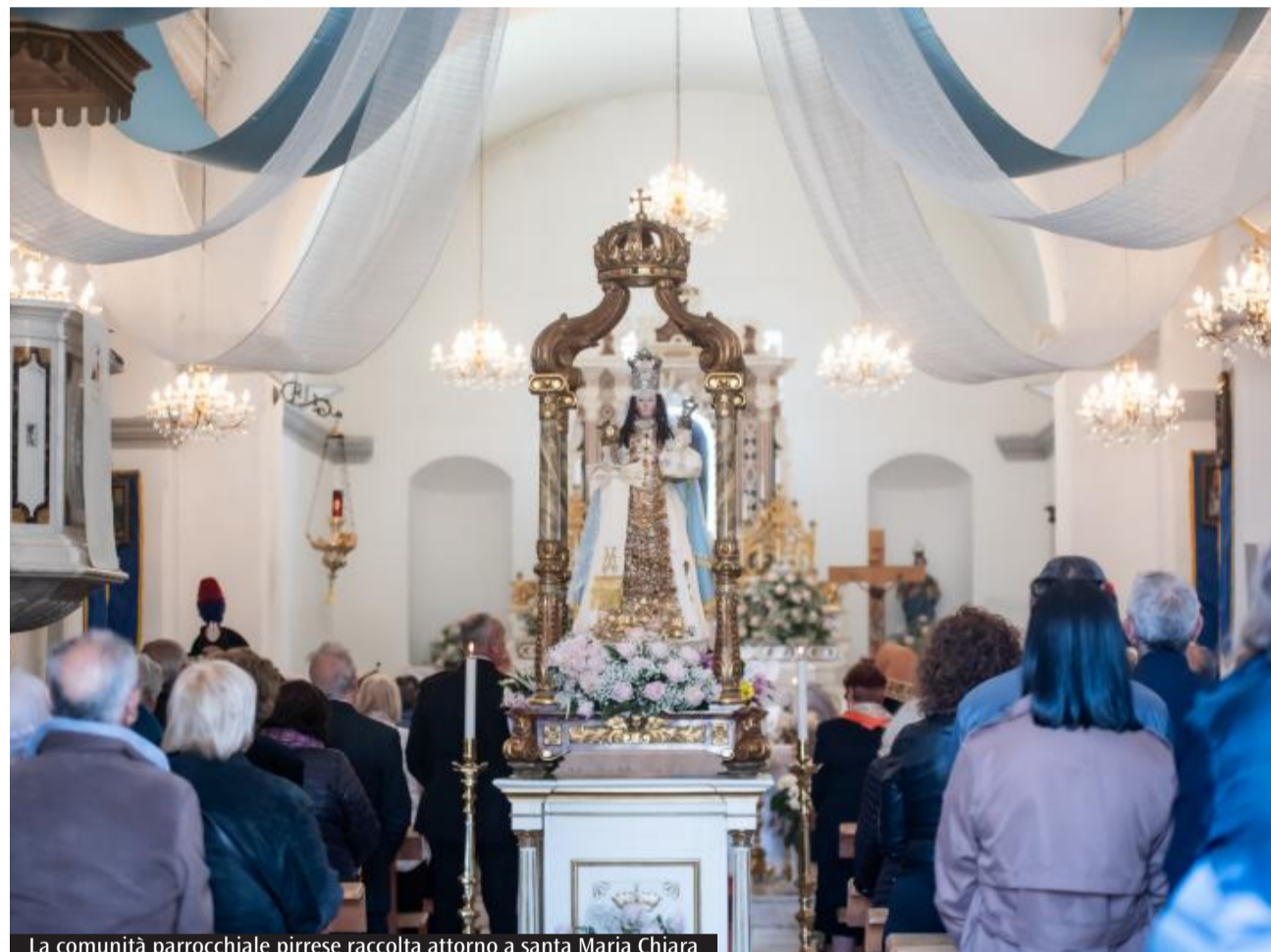
La comunità parrocchiale pirrese raccolta attorno a santa Maria Chiara