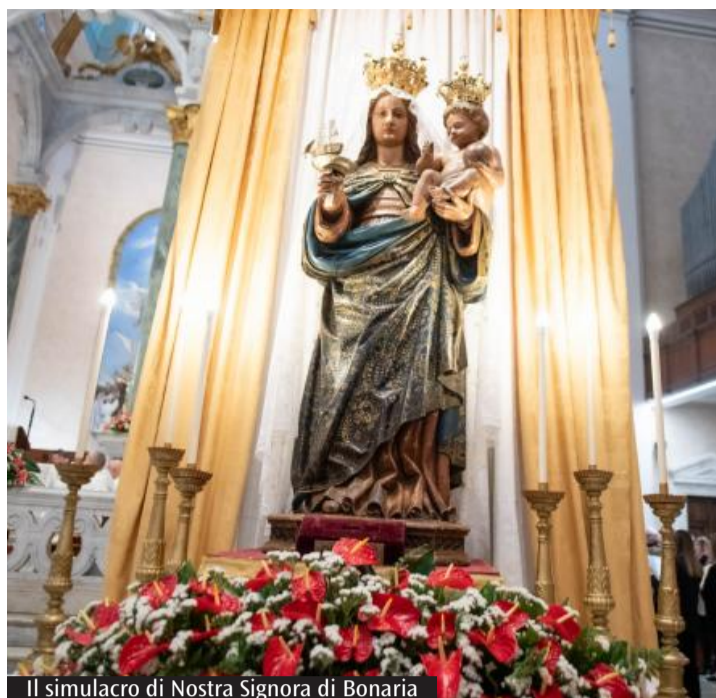
Il simulacro di Nostra Signora di Bonaria